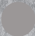
P148 FLORENCE GREY