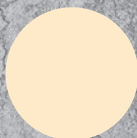
P010 NATURAL WHITE