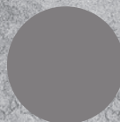
P156 PLATINUM GREY