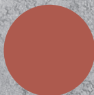
P52 BRICK BROWN