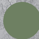
P119 OLIVE GREEN

Popustte uzdu fantazii a vytvořte povrchy, které budou skutečně originální. Inspirujte se na www.betone.cz .